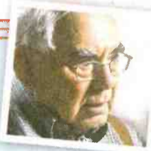
צילומים מתוך הסרט

"אברהם שלום נסע לאחרונה לסיור ביו"ש לראות מה קורה שם. הוא אמר 'הפסדנו, אין יותר סיכוי לשתי מדינות'. הייאוש הזה הולך איתי"