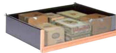
Tiroir de rangement Storage drawer

La Cave à Cigares est étudiée pour être évolutive. Plusieurs types de rangements vous sont proposés pour répondre au mieux à vos besoins.