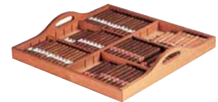
Plateau de présentation sur clayette coulissante (en bois exotique imputrescible). Presentation tray on sliding rack (in rot-proof exotic wood).