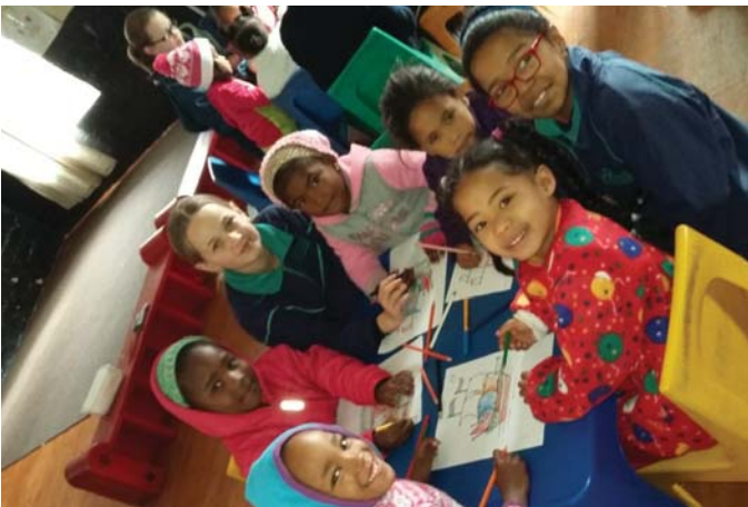
GRAAD 4 UITREIK NA JACK EN JILL SPEELSKOOL