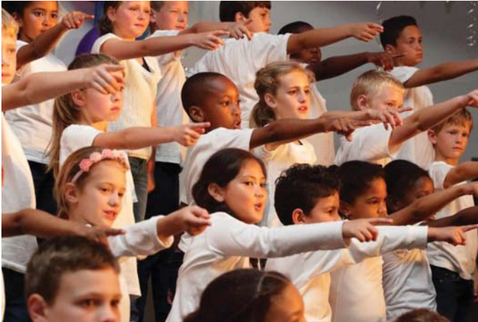
AAND VAN VERERING