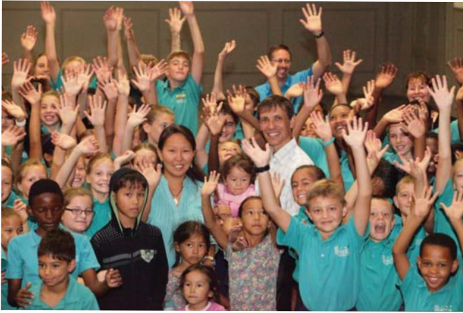
SAALBYEENKOMS MET 'N BESOEKENDE RUSSIESE SENDELINGFAMILIE EN OPEN DOORS